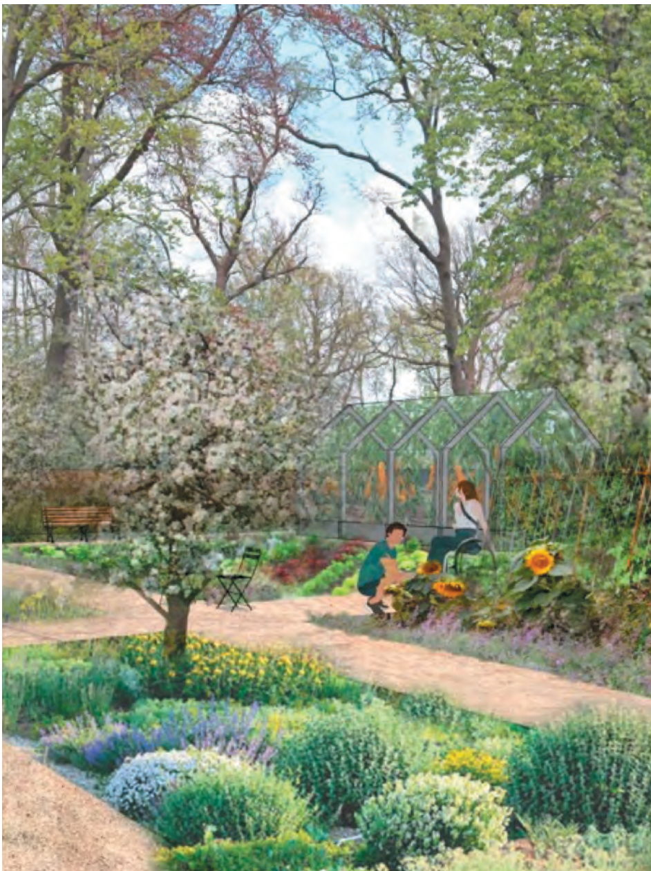
Impressie van de moestuin

Tegelijkertijd zijn er op onderdelen officiële procedures nodig, zoals vergunningaanvragen, en die kosten tijd. Ook hebben we nog niet al het geld bij elkaar. De jaarlijkse onderhoudskosten kan de stichting uit haar exploitatie financieren. Voor de eenmalige kosten voor de aanleg van de tuin vragen we bijdragen van de overheid en particuliere fondsen.'